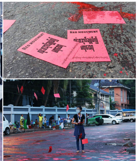
ဧပြီလ ၁၀ ရက်၊ ရန်ကုန်တက္ကသိုလ်အဖွဲ့က ရွှေတိဂုံအရှေ့မှ၌ ပြုလုပ်ခဲ့သည့် ‘အုပ်ချုပ်ခွင့် လုံးဝ မရစေရ’ အနီရောင်လှုပ်ရှားမှုတခုကို တွေ့ရစဉ်

မိုးကုတ်မြို့ရေပူဆရာတော် အပါအဝင် (၃၁)ဦးကို ထောင်ဒဏ်(၃)နှစ် ချမှတ်ခဲ့ ဟုသိရ